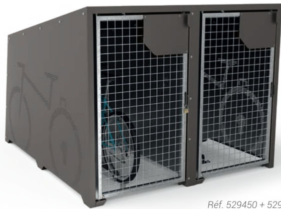
Réf. 529450 + 529454 + 529455