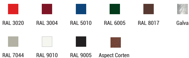
Réf. 529451 + 529455